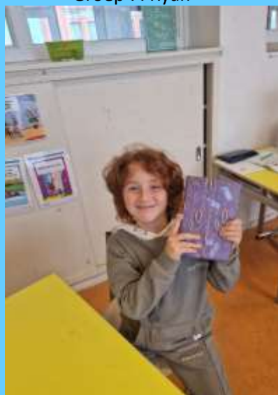
Winnaar van de fotowedstrijd groep 6.